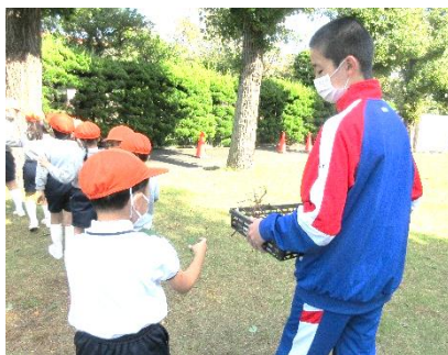
↑幼稚園で園児さんと芋掘り。