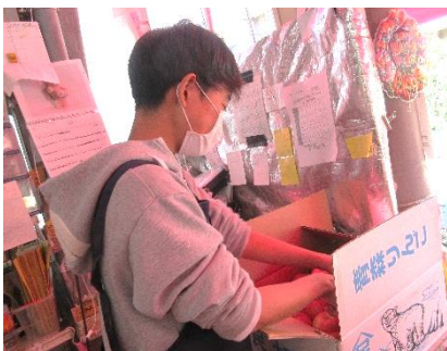
↑アキダイでりんごの品出し。