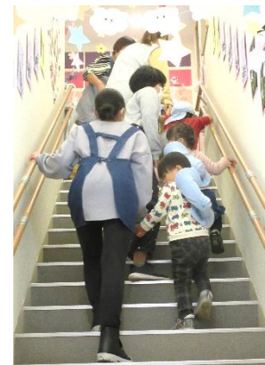
↑保育園で園児さんとお散歩。