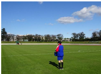
↑武蔵野体育館で陸上競技場の芝生のお手入れ。