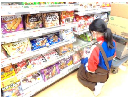
↑コープ東伏見で品出し中。

約一ヶ月延期になった職場体験が無事に終わりました。延期になった関係で体験先が変更になった生徒もいましたが、みんな行った先の事業所で一生懸命活動していました。私たちが巡回に行くと、『とても真面目な生徒さんで、よく頑張っています。』、『地道な作業も一生懸命やってくれます。』など、 お褒めの言葉 を多く頂きました。中には、緊張や恥ずかしさで控えめになってしまった人もいたようです。また、帰宅報告をすっかり忘れていた人も多くいました。体験先への行き帰りでトラブルがあったり、昼食で買った飲み物を歩きながら飲んでいて見事に目撃されたり、200人以上いればそれは色んな事が起こりました。しかし、そのような反省点も含めてとても大きな経験となる2日間でした。学校を出て、「働く」ことに触れ、生徒それぞれ感じたこと学んだことはあるはずです。どんな2日間だったかご家庭でも話題にしてください。