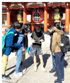
↑仲見世通りを歩く。これが結構楽しかった。