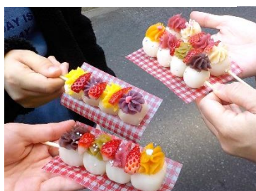
↑可愛いお団子見つけた。