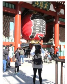
↑クロームブックで写真を撮る。