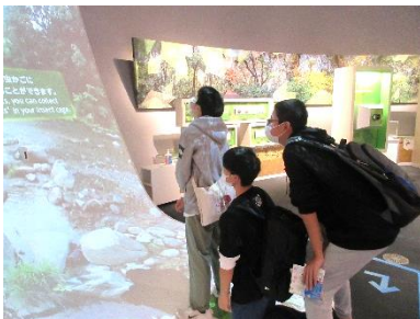
↑たどり着くのが大変だった気象科学館。楽しそうな施設でした。

虎ノ門ヒルズ駅からいくら歩いても気象科学館が見つからない。クロームブックで地図を見ても分からないし、人に聞いたら反対方向を教えられてしまったようだ。もう40分以上探している。本部に連絡し、諦めて吉祥寺への帰路についた。無事にたどり着けた班がうらやましかったな。