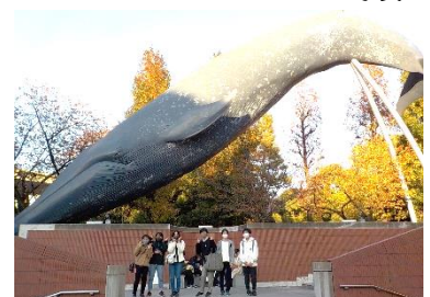
↑国立科学博物館も行きました。