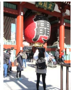
↑クロームブックで写真を撮る。