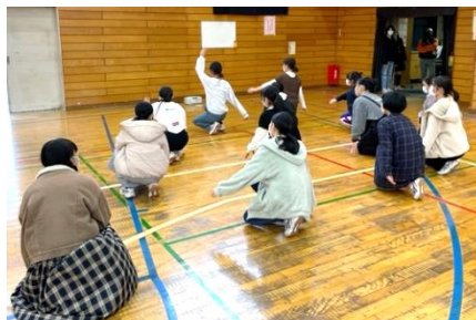
↑1年や他クラスとスペースを分けて練習しています。お互いにとって良い刺激となっています。特に授業が合同ではないクラスのダンスはとても新鮮のようです。