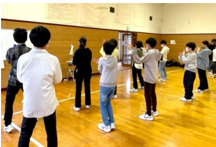
↑一生懸命練習をしています。