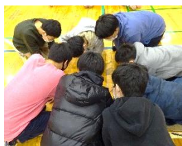
↑係はどうやって決めたのでしょうか。