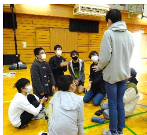
↑予想以上に、しっかりと自己紹介をしていました。

先週、実習班と宿舎班、バスの号車を発表しました。発表の前には各担任の先生から「どんなリアクションもしないように。」「静かに自分の班を確認するように。」と話がありました。それは、「やったー!!」でも「えー。」でも、そういう反応で嫌な気持ちになる人が周囲にいるかもしれないからです。全体では、6クラスの規模の学校では、卒業まで一度も話をしたことがない、名前も知らないという人が存在する可能性があること、今回のスキーで初めて関わる人がいることを話しました。初めて関わる時「あなた誰?」って言われるのと、「3日間よろしくね。」って言われるのとどちらが嬉しいか、そういう言葉かけの重要性を伝えました。その後、同じ部屋になった人たちと自己紹介・係決めを行い、実習班に並び替えてバス座席決めをしました。今までの人間関係を越えて、お互いに配慮しあって過ごせる3日間になると良いなと思います。スキー移動教室のスローガンは『輪を広げ、規律を守り、全力で楽しもう。』です。実行委員会の生徒たちが決めました。これが実現できると嬉しいです。