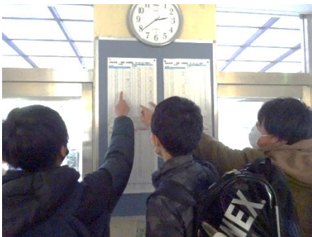
↑ランキング表、意外とみんな見る。

ランキング30位が掲示されると、何だか盛り上がり見ています。ひそかにランキングに載るのを目標に頑張っている人もいます。ランキングもありますが、昨年度の自分と比較しながら、自分の成長を感じてくれるといいなと思います。ツライの嫌だなあとか、持久走苦手だなあとか、色々あるのは分かっていますが、とにかく、一生懸命がカッコイイ!!