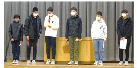
↓全校生徒の前は、ドキドキしますよね。

今週月曜日の生徒会朝礼では、生徒会役員がいじめシンボルマークの紹介、報道委員が昼放送の曲についてのお知らせ、JRC 委員がエコキャップがワクチンに変るまで、を紹介してくれました。なんと舞台上上がったのは全て2年生。2年生中心の石神井西中になってきたなと感じました。少し緊張した様子でしたが、みんな立派に発表してくれました。全校生徒 600 人の前で発表となると、誰でも緊張します。こういう経験を通して少しずつ自信をつけて、人前で堂々できるようにってなっていくと思います。頑張っています2年生。マル!!