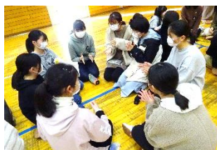
↑人の自己紹介には拍手で応える。いいね。