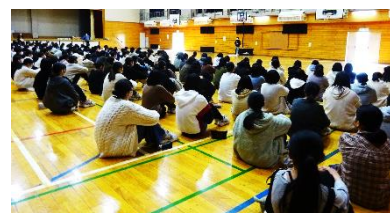
↑実習班への並び替えはとてもスムーズで、すごいと思いました。