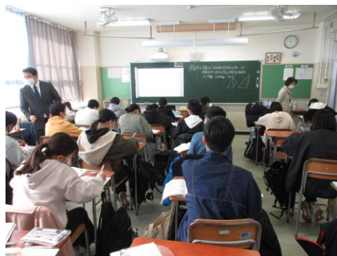
数学は図形を勉強しています。