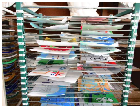
現在制作中です。とても面白いアイデアが出ているので完成が楽しみです。