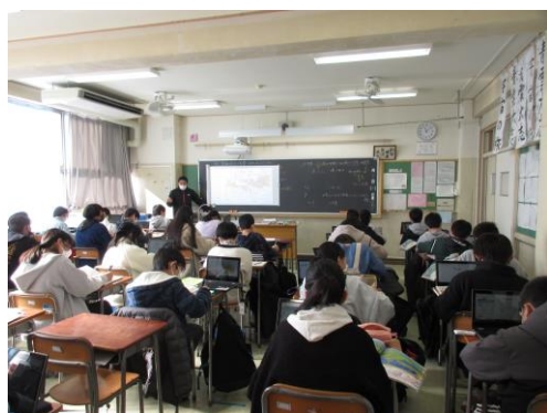
歴史の授業の様子。