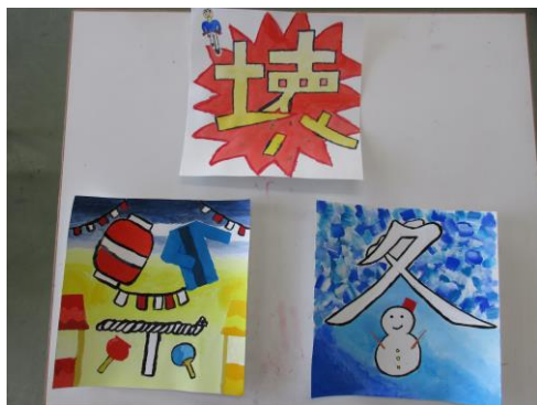
美術の授業では「絵文字」を制作しています。