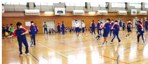
男子の剛速球！優勝はC組！

3/22(火)生徒たちが待望にしていたクラスマッチが行われました。体育委員・学級委員が中心になり、種目を決め、運営を行いました。どの生徒もクラスの勝利のため、一致団結して頑張っていました。