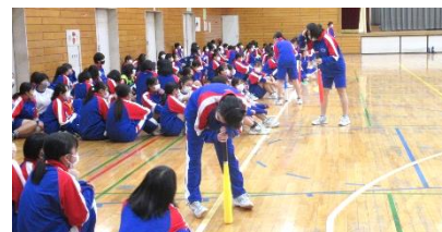
ぐるぐるバット！目が回ります！