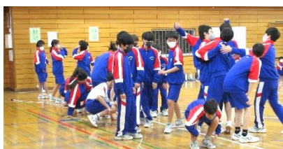
大縄優勝はE組！お見事！！