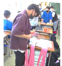
↑体育委員は、地域へのピラ配りやハチマキの分けなど、裏舞台でも一生懸命働いています。