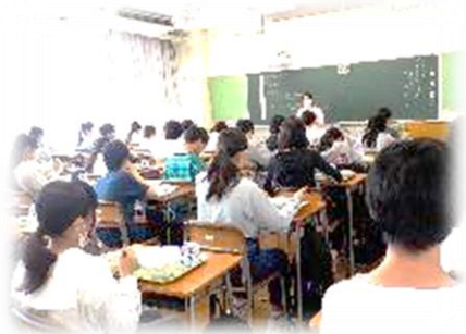
毎日のメニューの説明