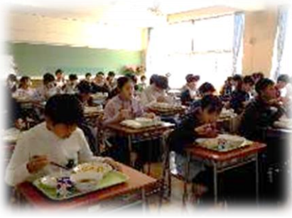
美味しい給食の開始