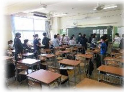
後片付けもしっかりと