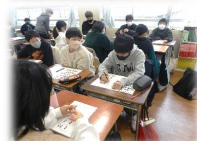
手話で伝えたい想い