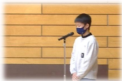
生徒会から目標の確認

また、生徒会からは生活目標の確認も行われました。今月の目標は『正しい服装、身を引き締め体調管理』です。体調管理はもちろんですが、服装確認についても今一度基本に立ち返って考えてほしいと思います。式服登校のときには基準がいつもより厳しいので、靴下の長さやネクタイ・リボンの着用について注意された生徒もいるのではないのでしょうか。私服でも最低限のマナーである、バッチをつける、清潔感のある髪型に整える、靴のかかとを踏まないなどは日頃から気をつけてください。2年生になったときに、先輩として恥ずかしくない学校生活を送ってほしいと思います。