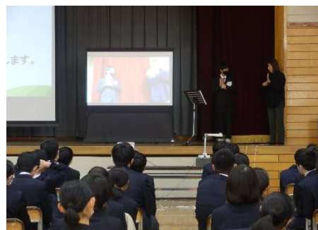
事前学習では、手話で自己紹介