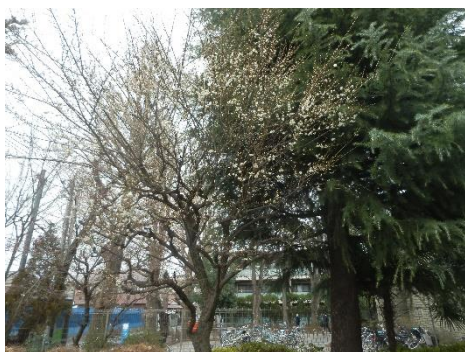
西門に咲く梅の木

「三寒四温」と言われますが、季節の変わり目で日々の気温や体感の変化が大きいこの頃です。また、「昨日はダウンコートでちょうど良かったのに、今日は暑く感じた」「昼間の気温に合わせてたら、夜はとても寒かった」ということもあるでしょう。日々の気温や天気をチェックして、衣服を重ね着するなど、上手に体感温度の調節をしてください。