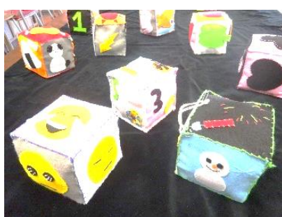
↑家庭科「ころころサイコロ」 幼児と遊ぶことを考えて作られています。中には鈴が入っていて、サイコロを振るとチリンチリンと音がしました。フェルトの模様がとても可愛かったです。