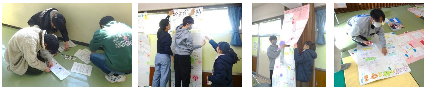
↑展示会準備の様子。係ごとに協力して作業を進めてくれました。この写真は総合のSDGs レポートの展示と、保健調べ学習の模造紙を掲示しているところです。

展示会の見学では、各フロアを2クラスずつ順番に回り見学をしました。3年生の出品作品は、国語の俳句、総合のSDGs学習、技術のキーホルダー、家庭科のサイコロ、美術の思い出の風景、書写の代表作品などがありました。どの作品も個性が溢れていて、一所懸命作成しているみなさんの表情が浮かびました。お互いの作品を楽しそうに眺めている姿も印象的でした。普段見ることのできない他クラス・他学年の人の作品から多くの刺激をもらっているようでした。持ち帰った際には、ご家庭でも作品を眺めながら、制作過程や込められた思いを聞いてみてください。展示会の見学に来てくださったご家族の皆様、ありがとうございました。