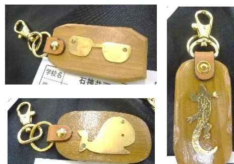
↑技術「キーホルダー」 真鍮(しんちゅう)をやすりで削って好きな形を作りました。個性豊かな作品がたくさんありました。