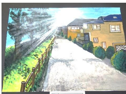
↑美術「思い出の風景」 通学路や教室、廊下、体育館、昇降口など、みんなそれぞれの思い出の場所を描いていました。