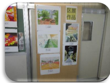
区展作品 思い出の風景