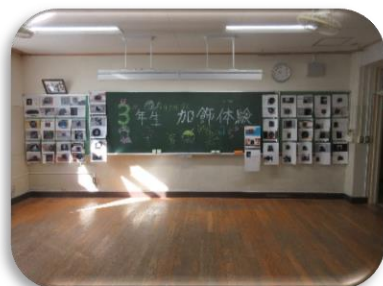
3年生 総合 展示スペース