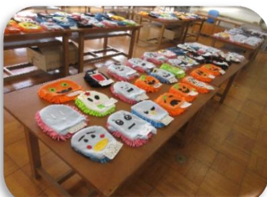
マイクロファイバークリーナー