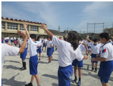
腕をしっかり伸ばして!