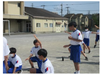
しっかりと教えられました