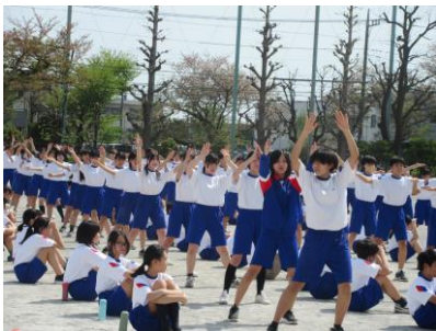
サクセスのお手本を見せます

15日(月)には1年生と合同の体育がありました。昨年は上級生から整列の仕方やダンスをひとつひとつ細かく教えてもらっていましたが、今年は後輩に教える立場となりました。立場が人を変えと言われる。その言葉どおりに、生き生きと丁寧に、そして一生懸命に教えている姿が見られ、生徒たちの成長を実感しました。保健体育科の菅野先生から授業の最後の講評で、「今日のような時間が2年生を2年生にしていける時間だ」というお話がありました。2年生になったからといって特別偉くなったわけではなく、何か特別な権利が与えられたわけでもありません。2年生としての「責任」を新たに背負うだけです。この日の合同体育では、誰もがその責任を果たし、立派な2年生としての一歩を踏み出した大切な時間となりました。