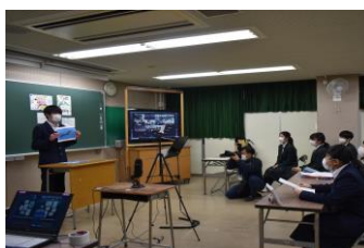
実行委員による進行