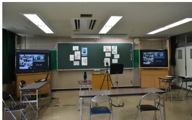
視聴覚室スタジオ