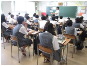
<1 年生:克己と強い意志>