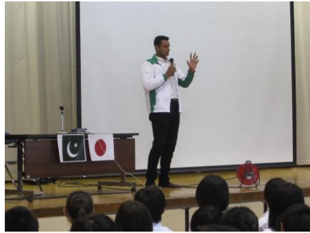
『オリンピックに出場して』