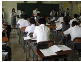
<3 年生:気高く生きようとする心> <F 組:向上心、個性の伸長、思いやり、感謝>