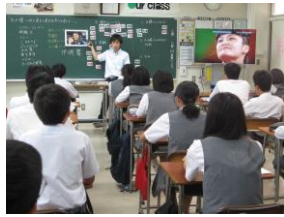
<2 年生:向上心と個性の伸長>