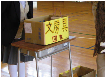
保護者会でのボランティア部員の活動

送付先は、中央共同募金会(東日本大震災義援金)、岩手県釜石市教育委員会です。ご協力ありがとうございました。