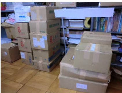
文房具類はダンボール箱13個分になりました。