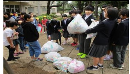
大南小にてキャップ回収

大泉第二中学校で行っている“エコキャップ運動（ペットボトルキャップ回収）”を、中学校生徒会役員が小学校に協力を求める形で、大泉第二中学校・大泉第二小学校・大泉南小学校の3校で協力して行い、交流をもつことができた。