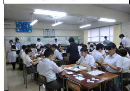
大二中検証授業と全体会

10協議分科会に分かれての授業研究を柱とする取組が今年度で6年目を迎えるが、COVID-19の影響で今年度はその分科会がまったくできなかった。来年度は中学校も新学習指導要領が施行となり、当然課題改善カリキュラム改変に取り組んでいかなければならない。