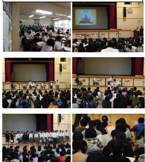
中学校授業見学・中学校説明会

例年2学期後半に大泉第二小学校と大泉南小学校の6年生と一緒に大泉第二中学校に集まり、大泉第二中学校生徒会役員が中心となって資料や映像を用いての中学校説明会を開催することにより、小学生の中学校生活に対する不安が軽減され、中学校生活への興味や見通しをもつことにつながっている。また、中学校生徒会役員とこの説明会に携わっている役員以外の生徒からは、これから入学してくる小学校6年生を温かく迎え入れようという雰囲気がうかがえるようになってきた。そしてこの説明会の前に実施している中学校授業見学会では、より専門的な授業を見学することにより、興味関心を更に高めることにもつながっている。