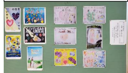
ポスター作品交流

大泉第二中学校と大泉第二小学校の距離が徒歩20分強と離れているため直接交流を実施せず、毎年11月に行われている“いじめ一掃プロジェクト「練馬区いじめ防止〇〇」”の各学年優秀作品をそれぞれの校内に3校分掲示し、3校での作品交流を行った。