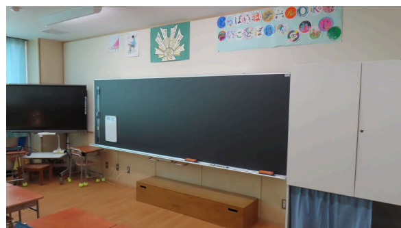
新しい校舎の様子