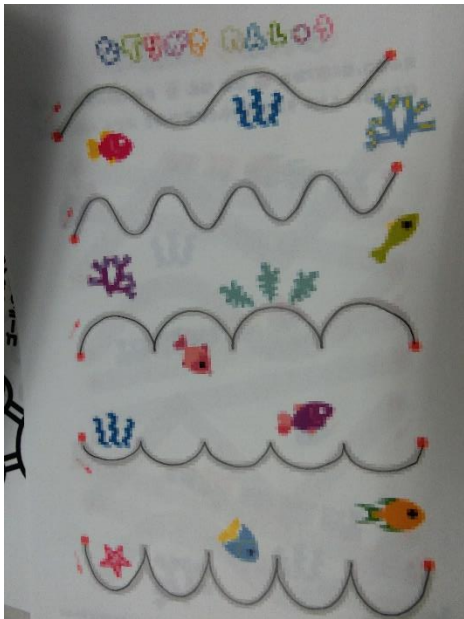
はみださないように、ていねいにね。