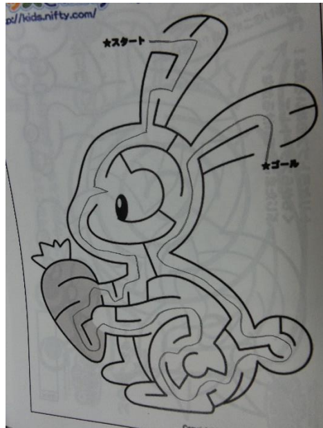
スタート：すたーと から ゴール：ごーるまで みちを まちがえたら もどってすすま しょう。