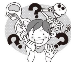
・体や健康について 知りたいとき