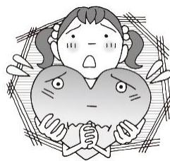
・なやみや 心配なことがあるとき