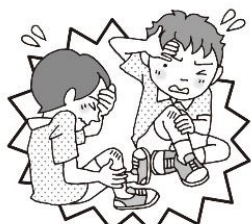
・けがをしたとき