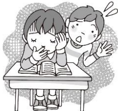
・具合が悪いとき