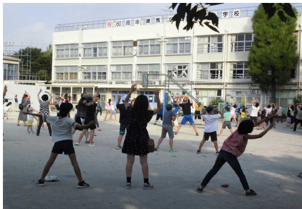
【小竹町会 2020 ラジオ体操】

2020年東京オリンピック開幕まであと1年となった7月24日スポーツの日の前日。