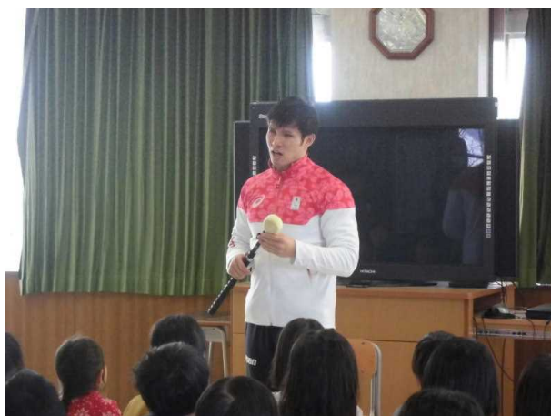
【パラリンピック競泳 木村敬一選手】