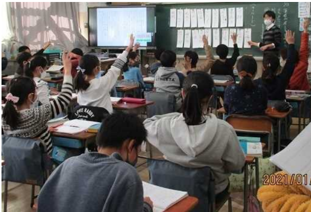
[5年 国語 研究授業]