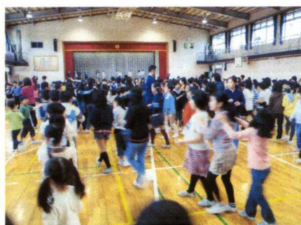
音楽集会（じゃんけん列車）