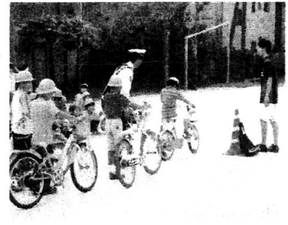
自転車乗り方教室(3年)