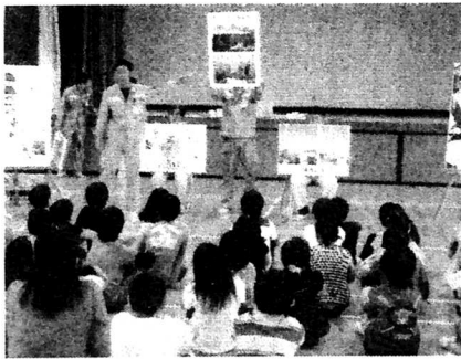
ふれあい環境学習(4年)