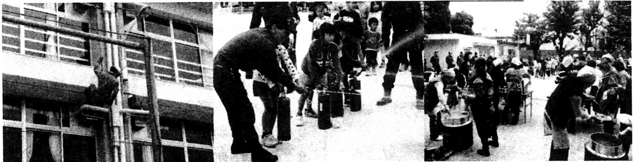
PTA 防犯防災体験教室