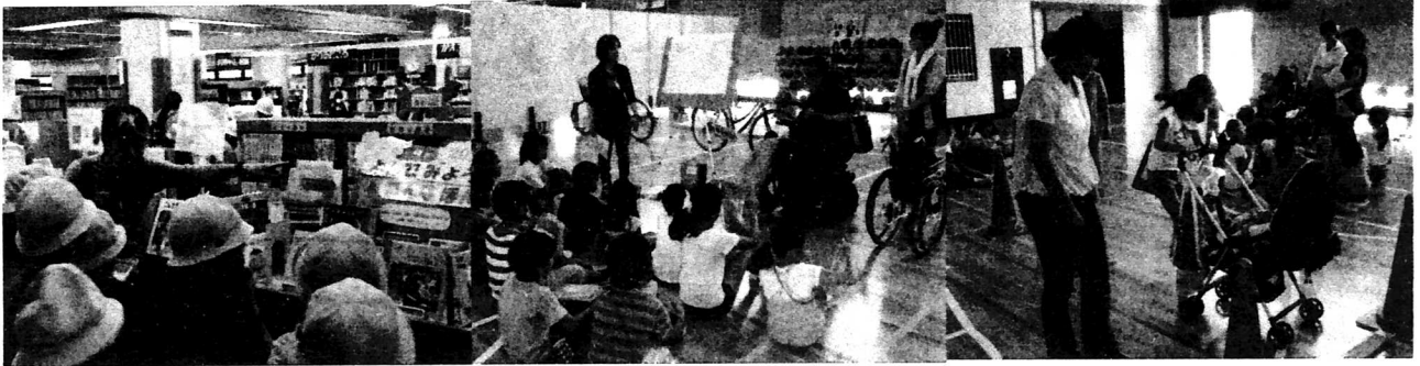
3年 練馬図書館見学