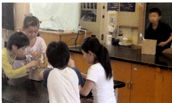
日本文化体験発表会 (華道)