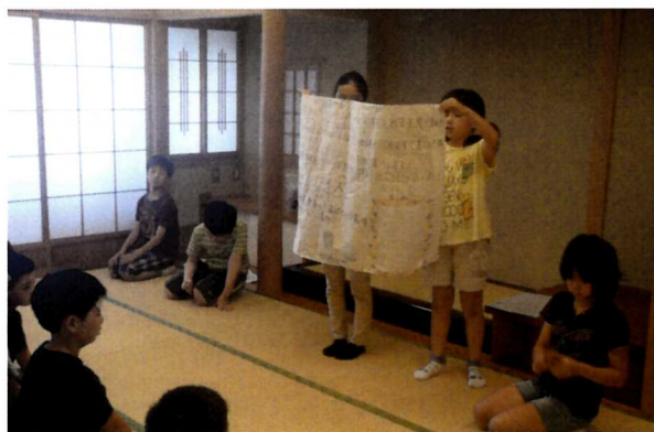
日本文化体験発表会 (茶道)