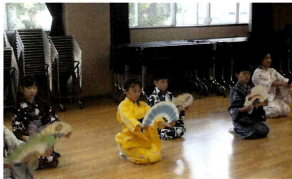
日本文化体験発表会 (日本舞踊)