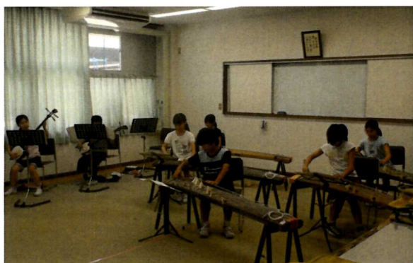
日本文化体験発表会 (お箏・三味線)