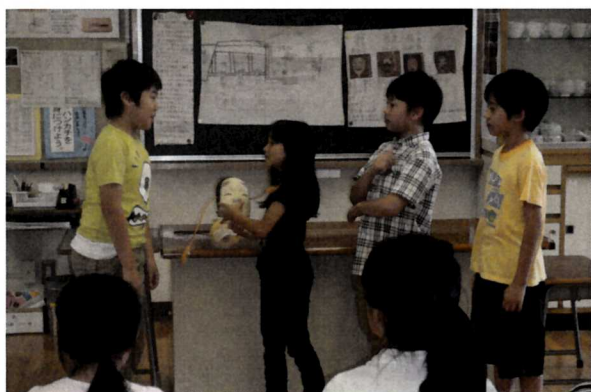
日本文化体験発表会 (能)