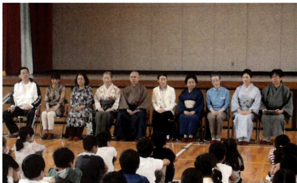
日本文化体験 (講師の皆さんの紹介)