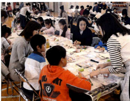
PTA 主催デコパージュ教室