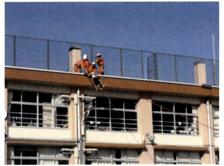
PTA 主催 防災防犯体験学習