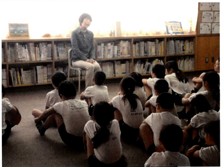
お話会（ねりまお話の会の皆様）