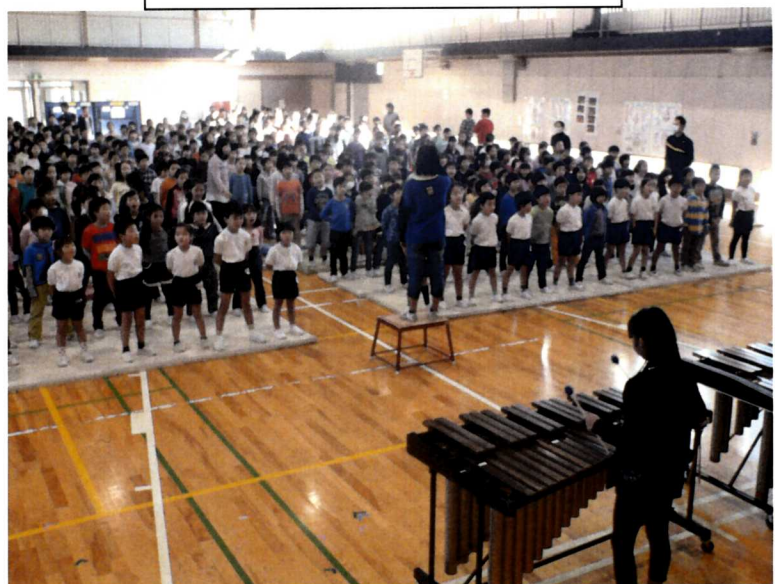
音楽集会（「ふるさと」合唱）