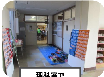
理科室で とよたまひろば