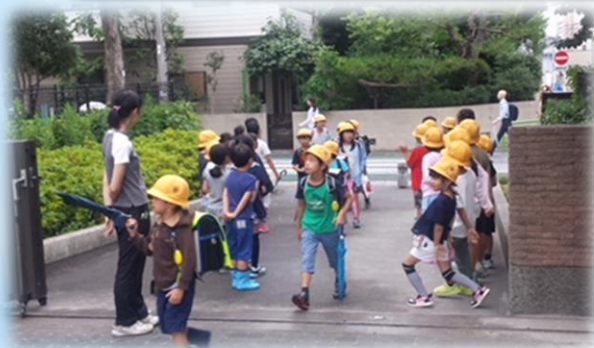
縦割り・1年生から