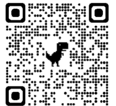
欠席等連絡フォームQRコード