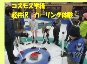
コスモス学級 軽井沢 カーリング体験