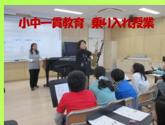
小中一貫教育 乗り入れ授業