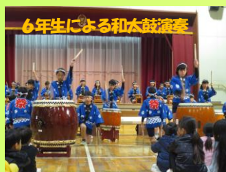
6年生による和太鼓演奏