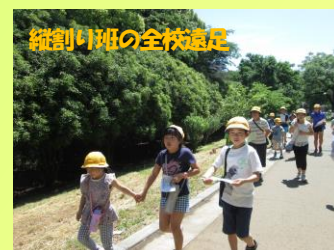
縦割り班の全校遠足