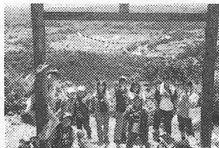
5～6月 仲間づくり（ハイキングなど）