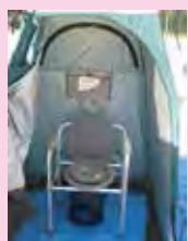
防災用品の紹介展示