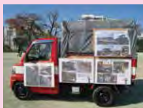
震災被害の写真が 展示されました。