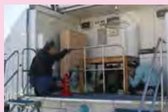
起震車で地震体験が できました。