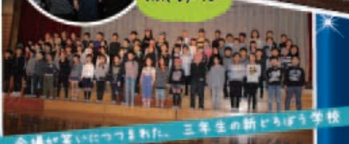
会場が笑いにつつまれた、三年生の新どうぼう学校