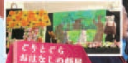
どきどきおはなしの部屋