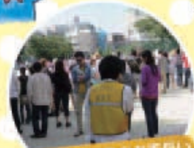
学校・地域行事のお手伝い

お手伝いを1つ登録するPTA活動。こちらは、 お手伝いは歓迎会、ラジオ体操、運動会、 ふれあい広場、ベルマーク集計、講習会参加、 氷川神社例大祭(2年に一度)、展覧会(2年に一度)