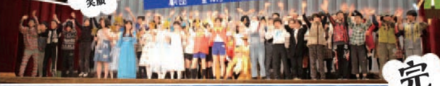
劇団「豊南」の完成です！！