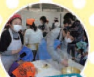
学級・教養委員 担任の先生と各クラスの 保護者との連絡係、学年活動の 実務など