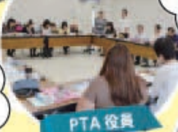
PTA 役員 役員及び会計監査、常任委員会、 正副委員長によって構成され、 毎月1回開催します