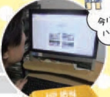
HP 紹介 各行事や、連絡事項など、 ママに更新しております!

地域育成活動への協力(ラジオ体操、 並語り、ふれあい広場、例大祭(2年に1度)など)