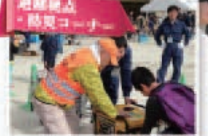
足踏観劇・紙芝居鑑賞