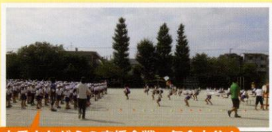
本番さながらの応援合戦。気合十分！