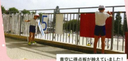
青空に得点板が映っていました！