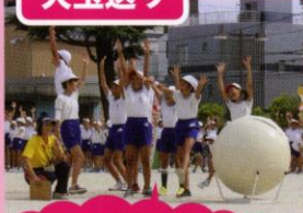
白組勝利のポーズ！