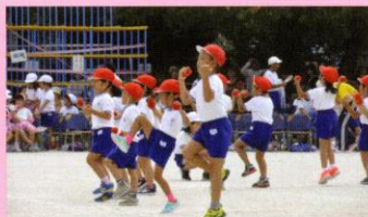
ダンシング玉入れ