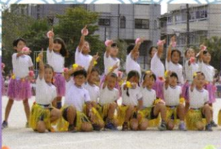
男女で違う振付にも挑戦。 可愛さの中にもキラリと光るカッコ良さ。