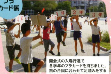
開会式の入場行進で各学年のプラカードを持ちました。笛の合図に合わせて足踏みをするタイミングを練習中です。