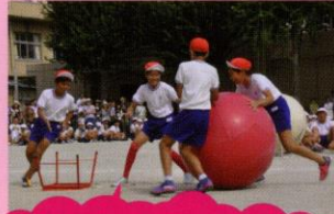
絶妙なチームワークの赤組