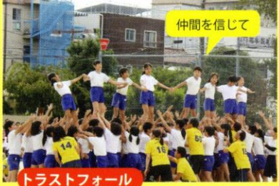
トラストフォール