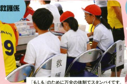
「もしも」のために万全の体制でスタンバイです。