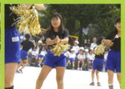
輝け未来～みんながみんな英雄～