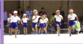
踊るのも走るのもすべて全力。それがぼくたち、わたしたち2年生！