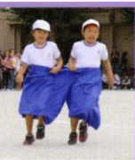
勝敗をかけた真剣勝負。だけどなぜ だかニコニコしてしまうのです。