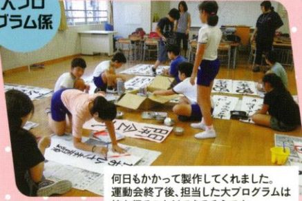
何日もかかって製作してくれました。運動会終了後、担当した大プログラムは持ち帰ることができるそうです。