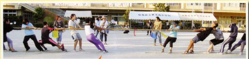
前日準備終了後の校庭では、PTA 競技のリハーサルも行われました！