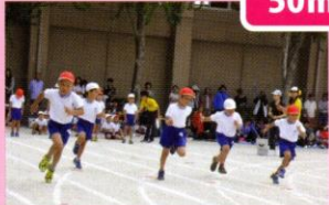
小学校での初めての運動会！ 元気いっぱい走り切りました。