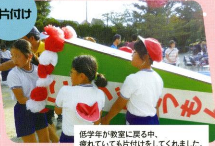
低学年が教室に戻る中、疲れていても片付けをしてくれました。