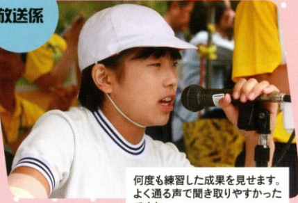
何度も練習した成果を見せます。よく通る声で聞き取りやすかったですね。