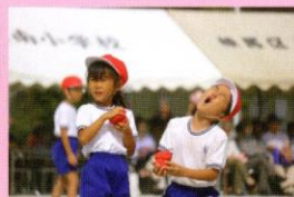
投げる・拾う・また投げる、 最後まで全力です！