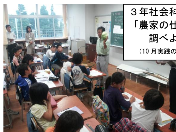
3年社会科 「農家の仕事を 調べよう」 (10月実践の授業)