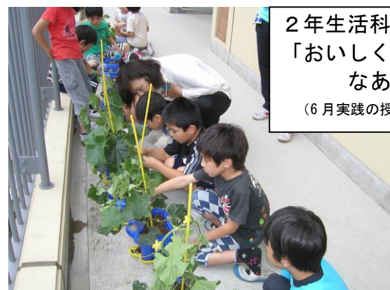
2年生活科 「おいしく なあれ」 (6月実践の授業)