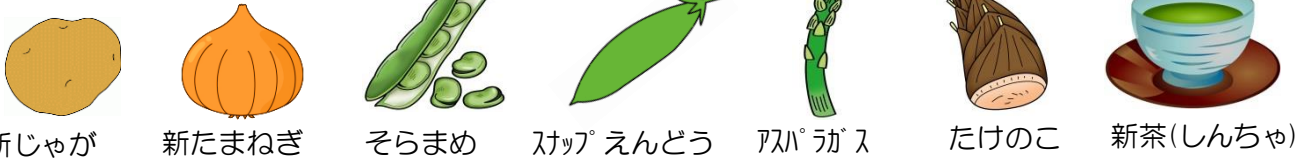
新じゃが 新たまねぎ そらまめ スナップえんどう アスパラガス たけのこ 新茶(しんちゃ)