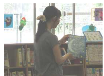
おひさまの会：振り返り