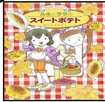
【ルルとララのスイートポテト】 作・絵 あんびるやすこ