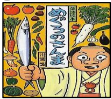
【めぐろのさんま】 作・絵：川端 誠