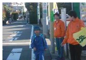
スクールガードによる 登校見守り