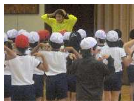
スポーツ教室 サッカー元日本代表 福西崇史さん