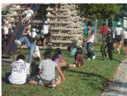
芝生に囲まれた大滑り台