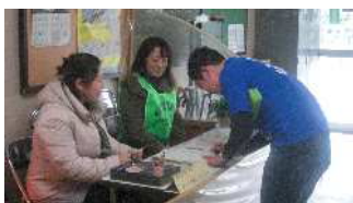
学校安全安心ボランティア