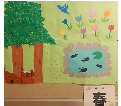
掲示委員会児童作品

ご家庭でも、進級・進学に向けて有意義な春休みになるよう、話し合いをお願いいたします。