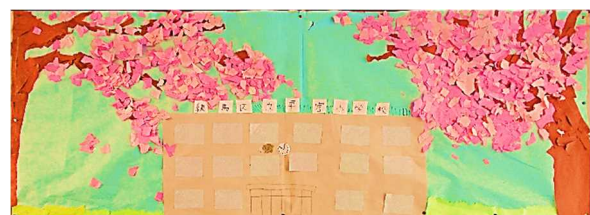
掲示委員会児童作品

早宮小学校のいじめ防止の取組を練馬区教育委員会より評価していただき、学校(園)奨励賞小学校部門で表彰していただきました。