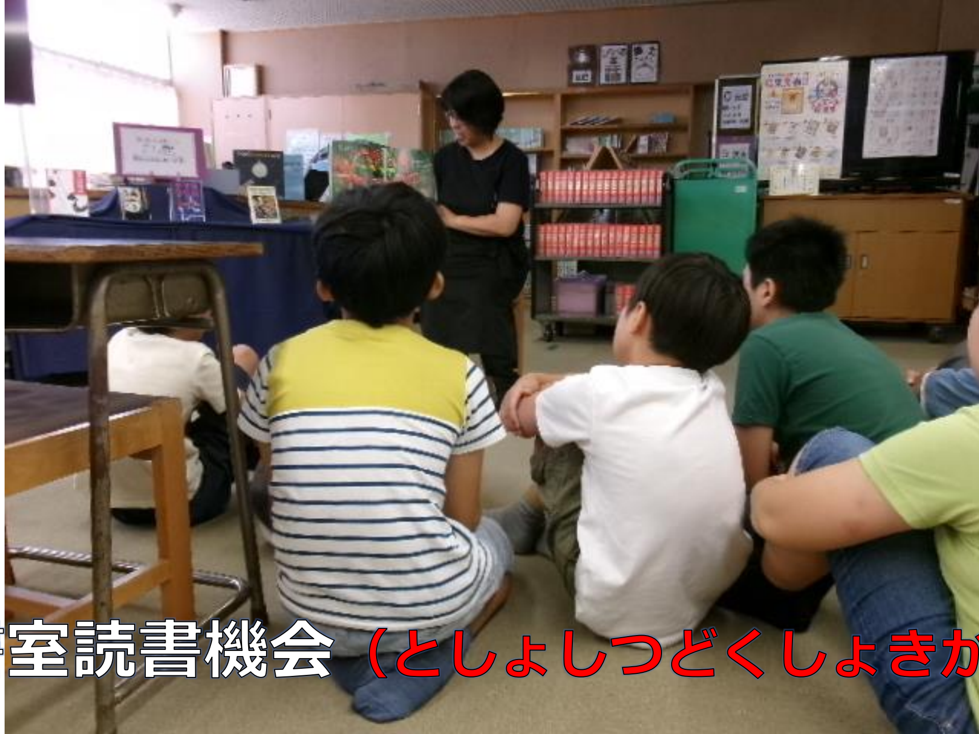
図書館読書機会 (としよしつどくしよきかい)