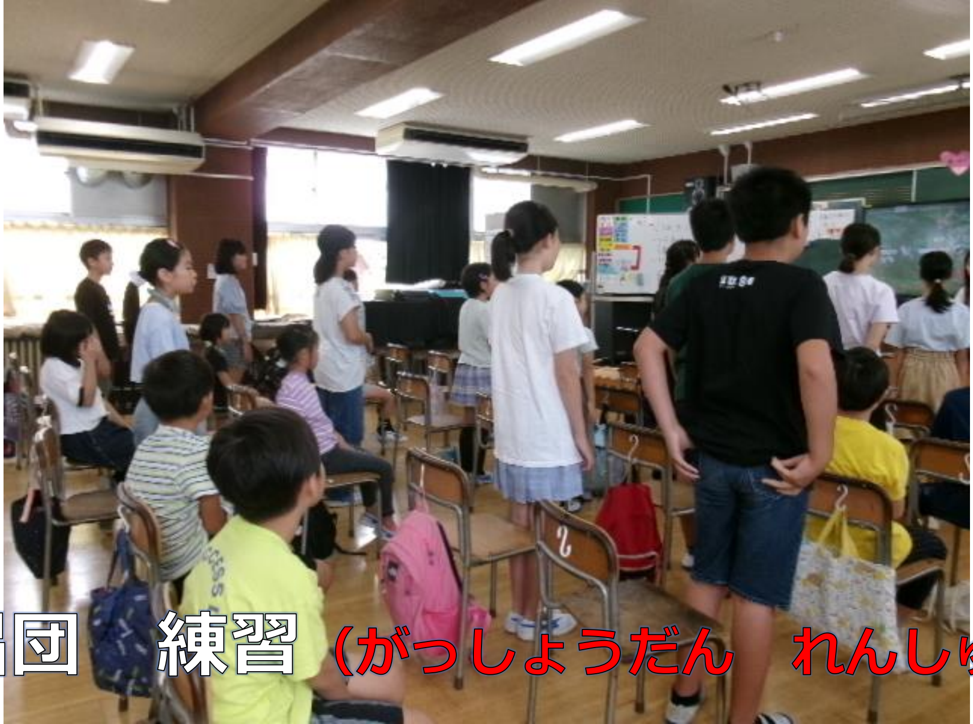
合唱団 練習 (がっしょうだん れんしゅう)