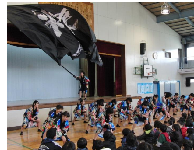
子ども音楽集會 中学生とソーラン節