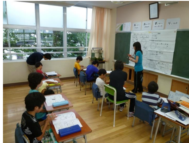
あおぎり学級（特別支援学級）