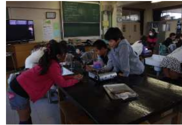
理科での実験学習