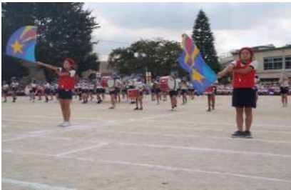
6年生によるマーチングバンド