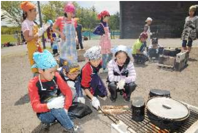
飯盒炊さんに挑戦