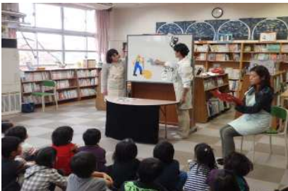
読書好きになろう