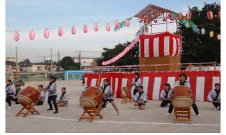
オープニングは仲町太鼓クラブ