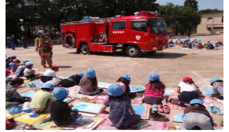
消防自動車を描きます