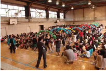
ようこそ仲町小へ