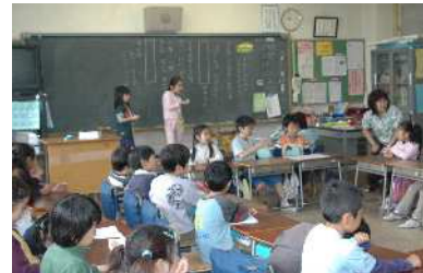
学級活動の話合い