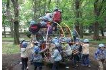
学年ごとに校外へ