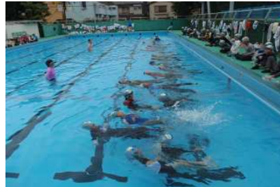
泳ぎを学びます（着衣泳）