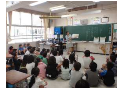
図書ボランティアによる読み聞かせ