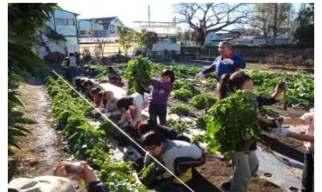
収穫が楽しみです