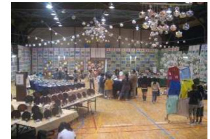
学習の成果を発表します