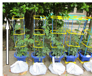
<ミニトマトの様子>

さて、5月には、学習のためにアサガオの植木鉢や種、ミニトマトの苗や土などを保護者の皆様を持ち帰っていただきました。約3週間が経ち、その成長がご家庭で観察できたのではないのでしょうか。私も時々、2年生の先生が植えたミニトマトの苗を見るのが楽しみになり、最近見に行くと、2倍以上の伸びで約60cmになっていました。これから植物の成長のように子供たちの元気な姿が見られるように学校再開の教育活動に努めてまいります。