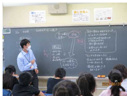
<道徳の授業の様子>

子供たちの意見では、「自分もゲームを止められないときがある。ゲームや読書などなかなか好きなことを止めることはできないが、後悔しないようにしたい。これからははじめをつけてやりたい。この授業を通して時間の使い方を一回見直してみたい。」などがありました。道徳教育は道徳の授業を要していますが、実践する場合は、学校や家庭や地域といった子供たちの生活全般であると捉え、心や行動の変化もじっくりと見ていきたいと思っています。ご家庭でのご協力もよろしくお願いいたします。