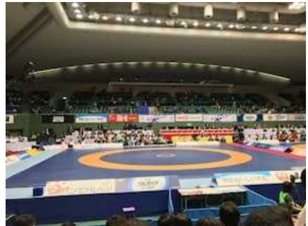
【駒沢体育館：レスリングのリング】

伊調 馨選手は、アテネ、北京、ロンドン、リオデジャネイロオリンピック金メダリスト、女子個人として人類史上初のオリンピック4連覇を成し遂げて、2016年国民栄誉賞を受賞した方ですが、2018年から東京オリンピックを目指して練習や試合を再び始めたようでした。