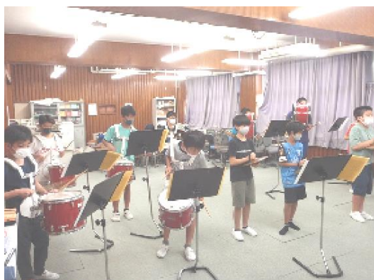
【6年生マーチング練習の様子】

42日間の夏休みを終えて、元気な子供たちの声が学校に戻ってきました。学校では夏休みの7月後半に夏季水泳教室を行いました。今年度は感染予防のため2クラスごとの実施でした。そのためプール内では十分に間隔を取ることができ、気持ちよさそうに水に慣れ、活動していました。また、6年生だけは8月後半にも連合水泳記録会に向けて水泳の練習もありました。6年生の中には「一人で泳ぐなんてできない。」「タイムをとるのは緊張する。」と言い、不安そうな様子の児童もいましたが、練習を重ねていくうちに、自信をつけ、楽しそうに泳げるようになっていました。記録が伸び、喜んでいる児童もいました。連合水泳記録会には6年生全員が出場し、一人一人タイムを計ります。今年度から連合水泳記録会は各校での開催となりました。そのため、他校の児童との交流はありませんが、自分の記録を伸ばすため努力をすること、友達と励まし合いながら練習すること、友達の見つけられることなど貴重な経験ができる機会です。6年生にとって連合水泳記録会が有意義な会になるよう6年担任だけではなく、多くの教職員で取り組んでいきます。そのため当日は1・2年生が4時間授業になります。ご了承ください。また、6年生は7月後半と8月後半に合計6回マーチング練習もありました。暑い中、学校に来て練習するのは大変なことです。6年生は嬉しそうに練習していました。仲町小伝統のマーチングを自分たちもできるという喜びを感じているようでした。この夏の練習の成果がきっと10月の表現発表会で表れることでしょう。夏休みの学習の成果も2学期に表れます。夏休みの学習の定着を図るテストを行う学年もあるようです。お子さんの学習状況をご家庭で確かめ、褒めて励ましてください。2学期も学校では感染予防に努めながら教育活動を進めて参ります。ご理解ご協力をよろしくお願いたします。